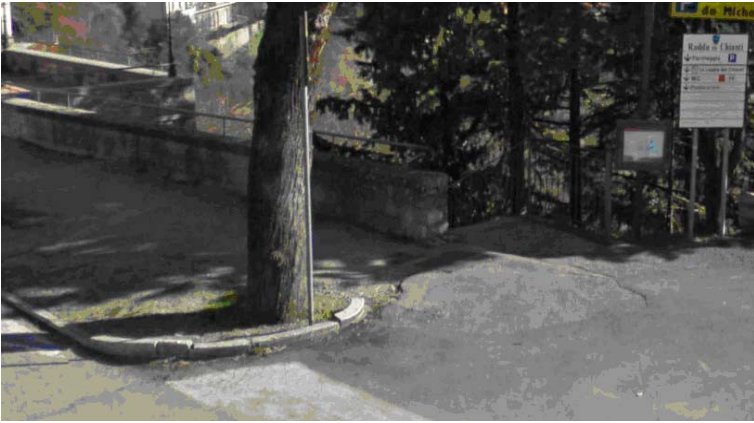
Fotografia 7 - In corrispondenza del secondo attraversamento pedonale si riscontra da una parte un piccolo scalino e dall'altra invece si ha una soluzione di continuità del piano di calpestio. La pavimentazione risulta comunque parzialmente sconnessa lungo tutto il marciapiede a causa della presenza delle radici degli alberi leggermente affioranti. Sono comunque assenti le differenziazioni tattili delle pavimentazioni all'attraversamento pedonale ad uso delle persone cieche.