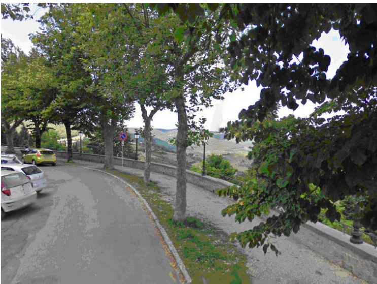
Fotografie 18 e 19 - La pavimentazione risulta parzialmente sconnessa lungo tutto il marciapiede a causa della presenza delle radici degli alberi leggermente affioranti e della vegetazione cresciuta nelle parti sconnesse del selciato.