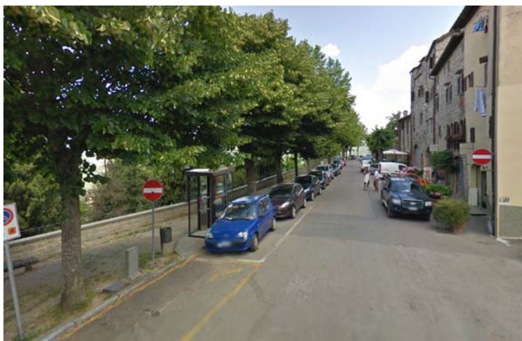
Fotografia 17 - Lungo viale Matteotti sono presenti anche posti auto e un posto riservato a portatori di handicap.

Il marciapiede, presente solo da un lato della carreggiata, si presenta abbastanza ampio sebbene il selciato sia spesso sconnesso a causa della presenza delle radici delle alberature presenti venute in parte in superficie e comunque caratterizzato da ghiaino.