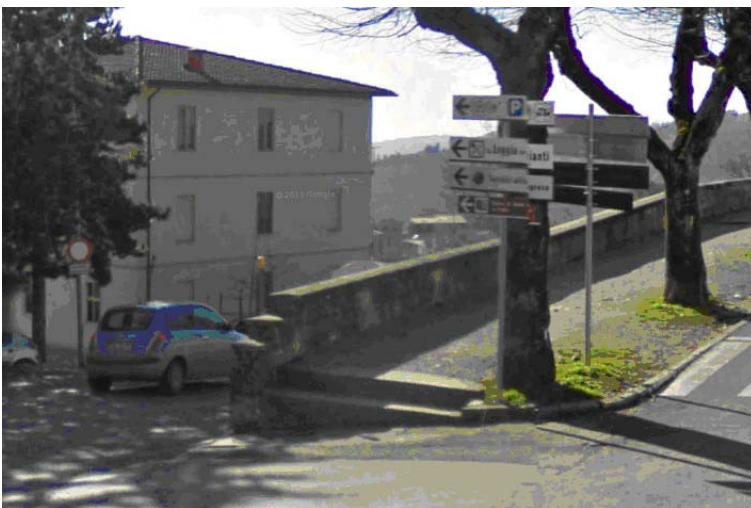
Fotografia 6 - In corrispondenza del doppio attraversamento pedonale si riscontra da una parte la presenza di due scalini che rendono inaccessibile l'ingresso alle carrozzine e dall'altro, sebbene sia presente solo un piccolo scalino, è comunque assente una differenziazione tattile delle pavimentazioni ed una guida tattile indicante la mezzera dell'attraversamento pedonale ad uso delle persone cieche

Da via XX Settembre si ha l'accesso ad un parcheggio pubblico che si trova ad un livello inferiore raggiungibile attraverso due rampe di scale dotate di servoscala.