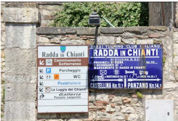
Fotografia 8 - Dall'attraversamento di cui sopra si ha inoltre accesso al parcheggio sotto stante attraverso due rampe di scale dotate di servoscala, come indicato anche nella segnaletica stradale di riferimento