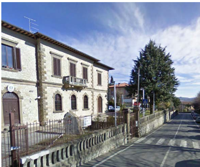
Fotografia 3 - La Caserma dei carabinieri si trova dal lato della carreggiata privo di marciapiede.

Si segnala pertanto che per i luoghi aperti al pubblico, lungo strada o marciapiede deve essere garantita la visitabilità di tali unità immobiliari, ovvero, per quanto riguarda il solo spazio esterno, deve esservi un percorso continuo che conduca fino all'ingresso a raso. (vedi D.P.R. 236/89 artt. 3, 5.5, 5.6 e 5.7; D.P.R. 503/96 art. 13). E' inoltre assente in presenza dell'attraversamento pedonale una differenziazione tattile delle pavimentazioni ed una guida tattile indicante la mezzera dell'attraversamento pedonale ad uso delle persone cieche.