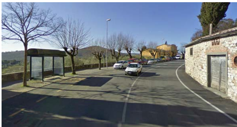
Fotografia 11 - Lungo via XX settembre è presente anche la fermata della linea di servizio del trasporto pubblico, dotata di apposita pensilina. Il percorso pedonale pertanto risulta particolarmente difficoltoso per le persone disabili – specie se su sedia a rotelle – a causa dell'ampiezza ridotta e della pavimentazione con risalti e sconnessioni.

Si segnala pertanto che per i luoghi aperti al pubblico lungo strada o marciapiede: deve essere garantita la visitabilità di tali unità immobiliari, ovvero, per quanto riguarda il solo spazio esterno, deve esservi un percorso continuo che conduca fino all'ingresso a raso. (vedi D.P.R. 236/89 artt. 3, 5.5, 5.6 e 5.7; D.P.R. 503/96 art. 13).