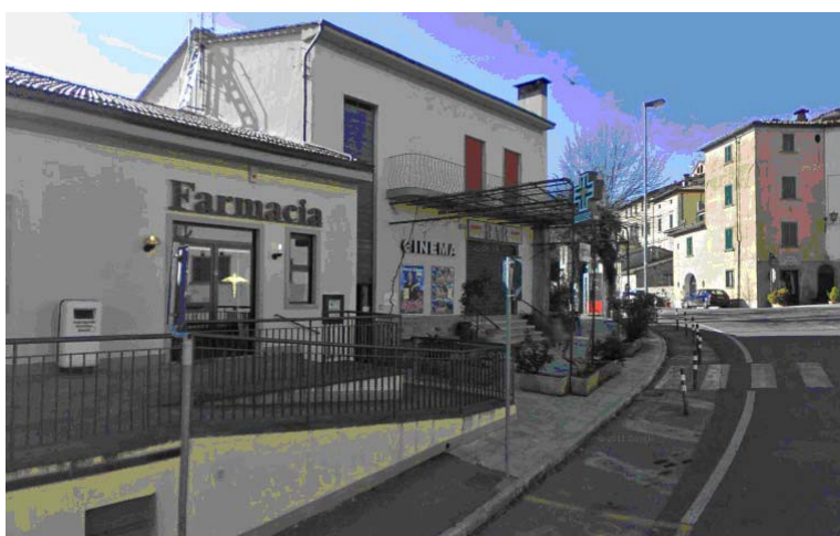
Fotografia 4 - La Farmacia comunale si trova su un livello più alto rispetto al piano di calpestio del marciapiede del viale.

Si segnala pertanto che per i luoghi aperti al pubblico, lungo strada o marciapiede deve essere garantita la visitabilità di tali unità immobiliari, ovvero, per quanto riguarda il solo spazio esterno, deve esservi un percorso continuo che conduca fino all'ingresso a raso. (vedi D.P.R. 236/89 artt. 3, 5.5, 5.6 e 5.7; D.P.R. 503/96 art. 13). E' inoltre assente in presenza dell'attraversamento pedonale una differenziazione tattile delle pavimentazioni ed una guida tattile indicante la mezzera dell'attraversamento pedonale ad uso delle persone cieche.