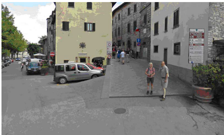
Fotografia 16 - L'accesso all'area pedonale è caratterizzato dal cambio di pavimentazione e dalla presenza di un piccolo scalino che introduce al camminamento pedonale con una lieve pendenza ma privo di aree piane di raccordo

Piazza Dante presenta le stesse problematiche riscontrate per Piazza IV novembre, sia per tipologia di utilizzo della piazza stessa sia per il piano di calpestio non regolare. Inoltre anche l'accesso al centro storico è caratterizzato da un piccolo dislivello altimetrico privo di apposita segnalazione.