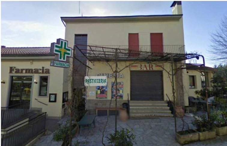
Fotografia 5 - Il Cinema, come la Farmacia, si trova su un livello più alto rispetto al piano di calpestio del marciapiede del viale. Il dislivello viene risolto attraverso quattro scalini, privi di servoscala.

Si segnala pertanto che per i luoghi aperti al pubblico e per le attrezzature per il ristoro, lungo strada o marciapiede deve essere garantita la visitabilità, ovvero, per quanto riguarda il solo spazio esterno, deve esservi un percorso continuo che conduca fino all'ingresso a raso. (vedi D.P.R. 236/89 artt. 3, 5.2, 5.5, 5.6 e 5.7; D.P.R. 503/96 art. 13).