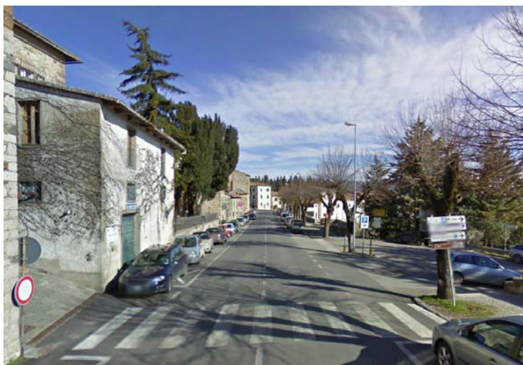
Fotografie 9 e 10 - Una visione d'insieme di via XX Settembre mostra chiaramente come il marciapiede si trovi esclusivamente dalla parte di carreggiata precedentemente analizzata.

Si segnala pertanto che per i luoghi aperti al pubblico lungo strada o marciapiede: deve essere garantita la visitabilità di tali unità immobiliari, ovvero, per quanto riguarda il solo spazio esterno, deve esservi un percorso continuo che conduca fino all'ingresso a raso. (vedi D.P.R. 236/89 artt. 3, 5.5, 5.6 e 5.7; D.P.R. 503/96 art. 13).