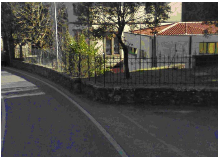
Fotografia 2 - In alcuni tratti il marciapiede risulta assente da entrambe le parti della carreggiata.